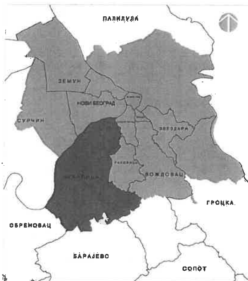
Слика 1: Позиција градске општине Чукарице у односу на друге градске општине Града Београда